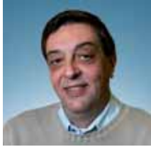
►► Andrés Arconada